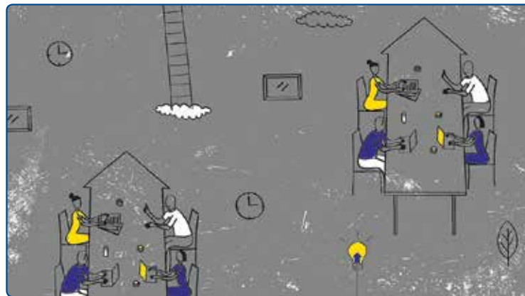
илюстратор: Надежда Георгиева

С наша подкрепа през 2015 Виваком стартира новата си програма Регионален грант . Нейната цел е да подкрепи най-различни проекти и идеи из цялата страна, с които хората искат да направят нещо добро, значимо, различно и важно за тяхната общност или просто ги кара да се чувстват щастливи. Допустими кандидати са НПО в обществена полза, читалища и училища. Общият размер на фонда е 50 000 лева, като всеки проект, който ще бъде подкрепен, може да бъде с максимална стойност до 5000 лева. Повече за програмата можете да прочетете на www.vivacomfund.org или на www.bcnl.org .