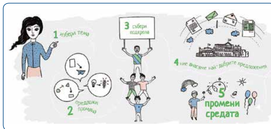
илюстратор: Надежда Георгиева

средства, за да „купи“ свободно време за родители на деца с увреждания - те обучават доброволци, които за два часа да заместят майките, като гледат техните деца. Фондът за организиране на кампании стимулира хората да са активни и до момента, при предоставени близо 50 000 лв., организациите са събрали над 215 000 лв.