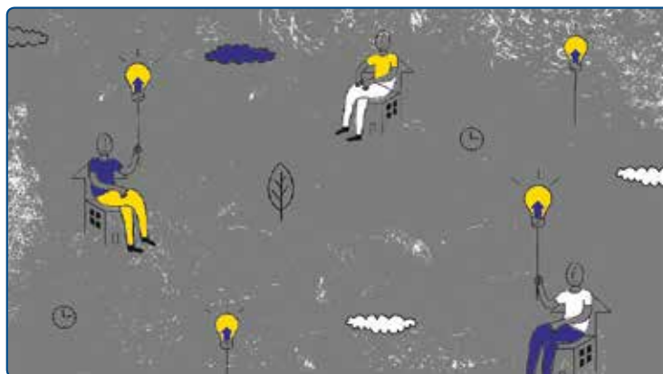
илюстратор: Надежда Георгиева

Повече за тази програма може да прочетете на специалната страница www.equalrights.bcnl.org