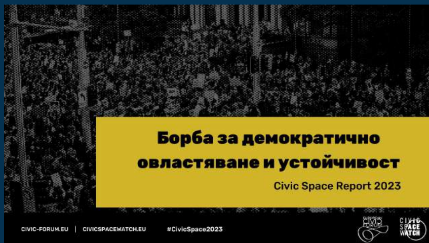
Доклад за състоянието на гражданското пространство – 2023 г.

Оценка на въздействието на Закона за предприятията на социалната и солидарна икономика