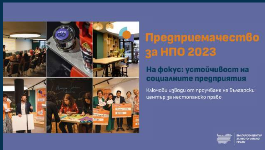
Доклад за социалното предприемачество през 2023 г.